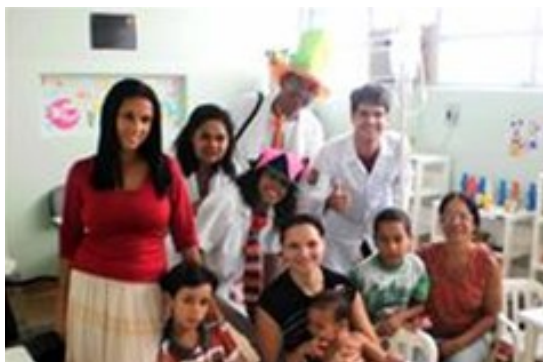
Projeto Enfermeiros do Riso promoveu palestra para pacientes

O projeto Enfermeiros do Riso, em comemoração ao Dia do Farmacêutico na quinta-feira (20), fez uma parceria com o CFARM para levar informações ao público do Centro Médico Hospitalar da Corporação (CMH) sobre a prevenção do uso de medicamentos.